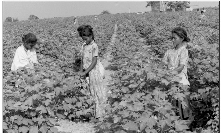
Noch immer müssen Kinder bei Zulieferern des BAYER-Konzerns arbeiten

Es folgten kritische Medien-Berichte, und tatsächlich bekannten die Unternehmen sich öffentlich zu ihrer Verantwortung für die Zustände. BAYER-Vertreter räumten ein, dass das The-