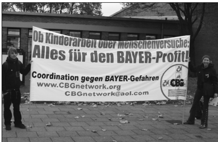
Der Druck auf BAYER muss mit weiteren Aktionen verstärkt werden, um die Ausbeutung indischer Kinder zu beenden

weniger als „gelöst“ dar. Vor Ort geschah jedoch lange nichts. Erst im Juli wurden die Zulieferer von BAYER-Vertretern darauf hingewiesen, dass sie ohne Kinderarbeit produzieren sollten. Zu diesem Zeitpunkt waren aber die Arbeitsverträge seit Monaten unterschrieben, auch hatte die Arbeit auf den Feldern bereits begonnen. Die meisten Zulieferer konnten oder wollten ihre Kinder-Belegschaften nicht mehr austauschen.