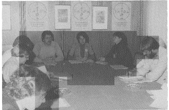
Reden und Anträge wurden auf einer Pressekonferenz der Öffentlichkeit vorgestellt

Die BAYER-Schikane zur Abwehr der Gegenanträge - extrem kurzfristiges Verlangen des Aktionärsnachweises - konnte aufgrund der schnellen und flexiblen Reaktion der kritischen BAYER-Aktionäre erfolgreich unterlaufen werden. Somit war BAYER gezwungen, die Gegenanträge seinen ca. 400.000 Aktionären bekannt zu machen. Natürlich mit dem Kommentar: "BAYER hält alle Anträge für unbegründet."*****